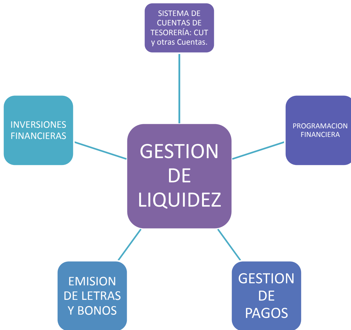
MODELO DE LA GESTION DE LA LIQUIDEZ