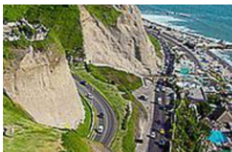
Malecón Costa Verde - Miraflores