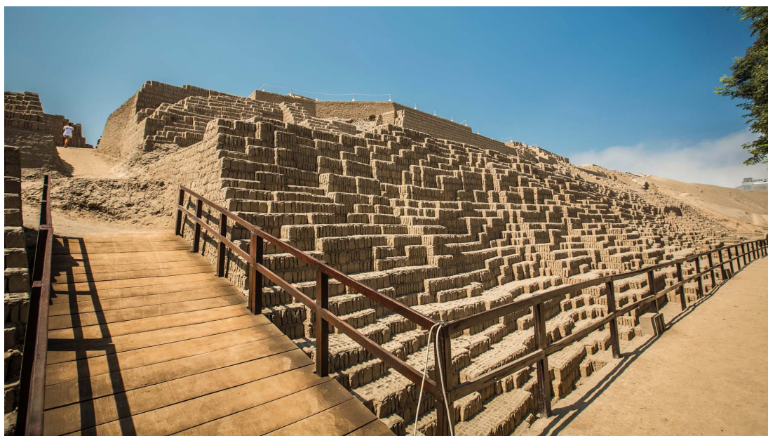
Sitio Arqueológico: Huaca Pucllana