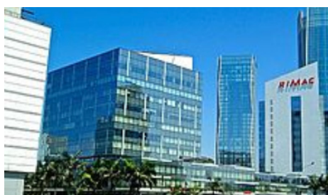
Centro Financiero – San Isidro